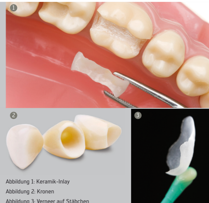
Abbildung 1: Keramik-Inlay

Bei größeren Defekten an Frontzähnen, starken Verfärbungen oder bei ästhetischen Korrekturen, können dünne Keramikschalen aufgeklebt werden. Sie werden im Dentallabor gestaltet und können so durch Farb- und Formanpassung Ihre Zähne verschönern. Anders als bei Kronen müssen die zu behandelnden Frontzähne für Veneers nur minimal an der Vorderseite abgeschliffen werden. Dadurch wird die Zahnhartsubstanz geschont.